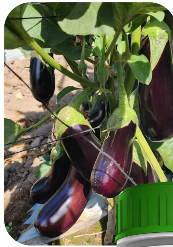
Después de la aplicación