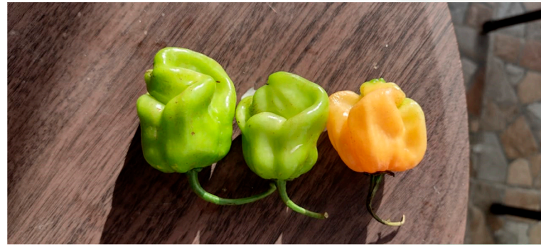
Testigo sin tratamiento

Fecha del Ensayo: Julio 2021 Tamaño de ensayo: 10 Plantas Cultivo: Chile Habanero Riego: Por Goteo