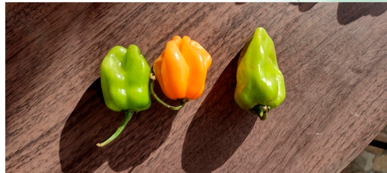
Tratamiento con Kelatop Calcio Boro