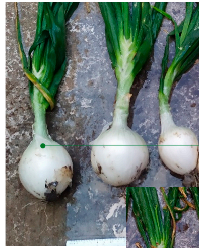
Testigo sin tratamiento

Resultados de la Efectividad de control de enfermedad de raíz rosada en cebolla ( Allium cepa ) con Purex Biosanitizer.